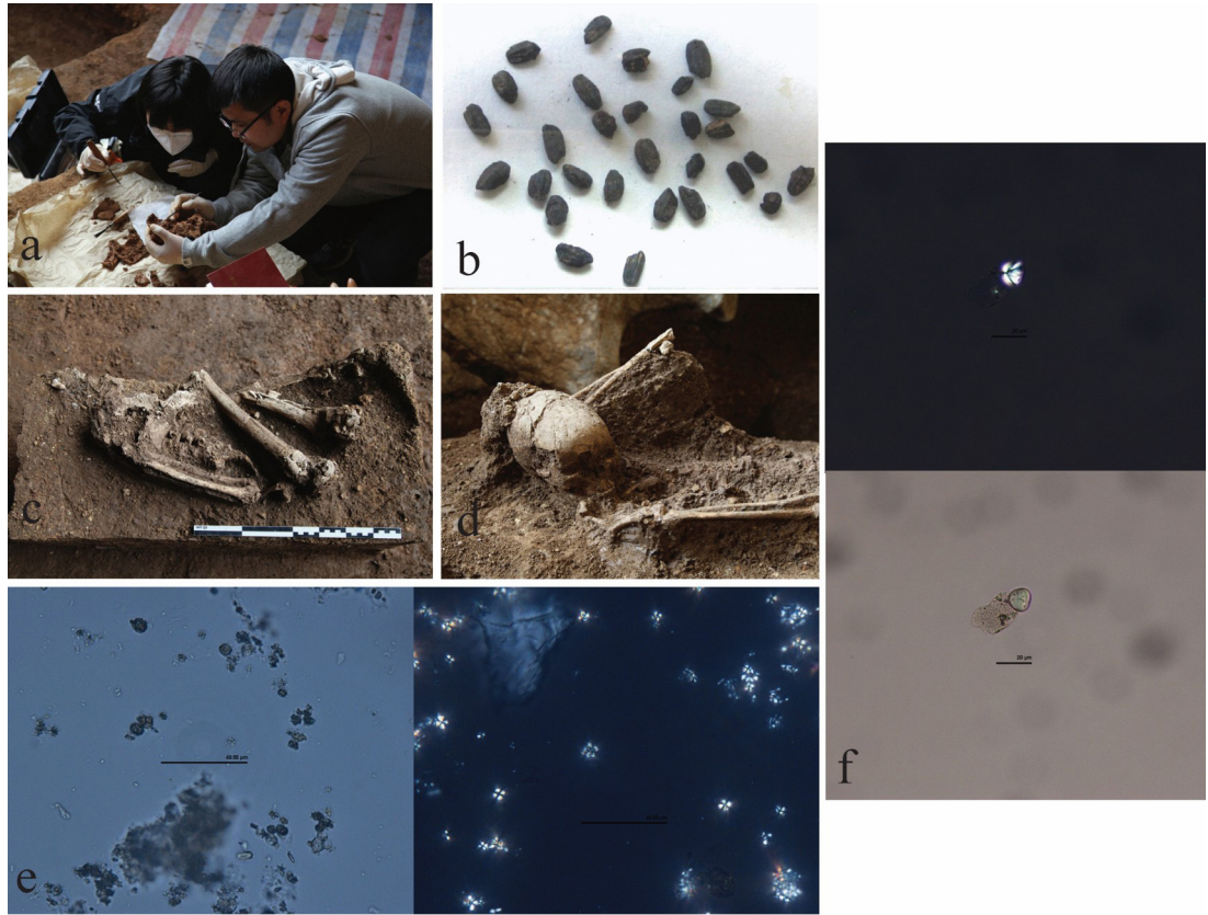
图 2 南山遗址采样发现植物遗存