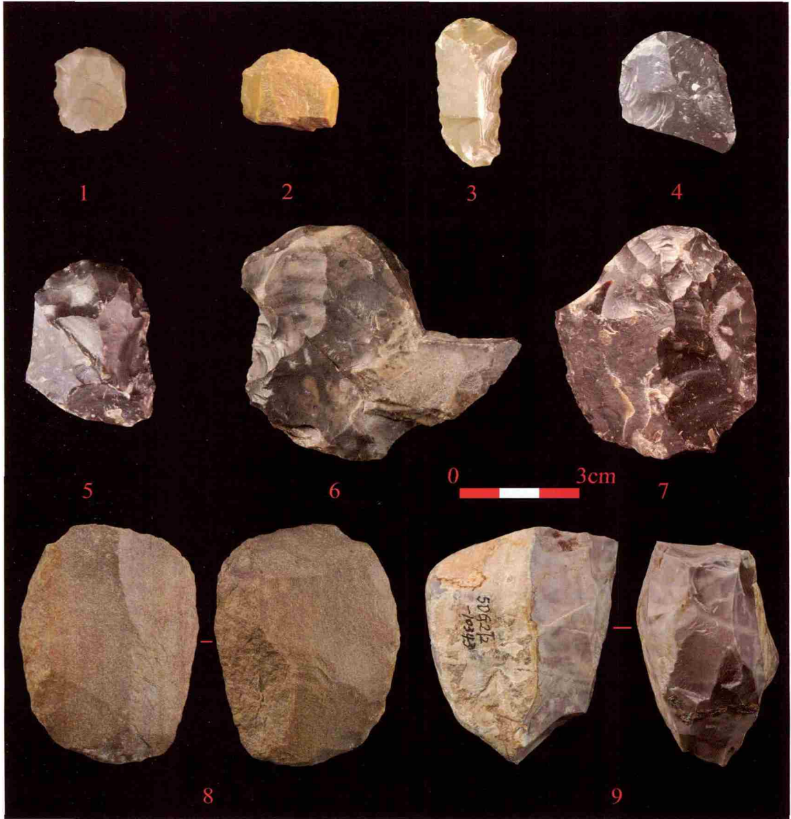
图 2 水洞沟第 2 地点发现的石叶石核与端刮器

第 2 地点的大规模及复杂用火、遗址空间的功能性分化被认为是现代行为 [3] 。遗址野外发掘共编号用火迹象 11 处，可称为火塘者 8 个，其他则为灰烬堆积。其中 CL1 层火塘 2 个、CL2 层 4 个、CL3 层 1 个、CL4 层 1 个。各文化层火塘未发现被明显构筑的痕迹，多为原地平面或挖浅坑堆烧。火塘中心( 红烧土 )范围直径在 20-55cm 不等，厚 4-6cm 左右。除 CL2 层火塘数量较多外，其他层位数量基本为 1 个，即便存在较多火塘的 CL2 层，不同用火迹象也可能是多次短期活动的结果。火塘周围常分布有动物化石，显示动物资源消