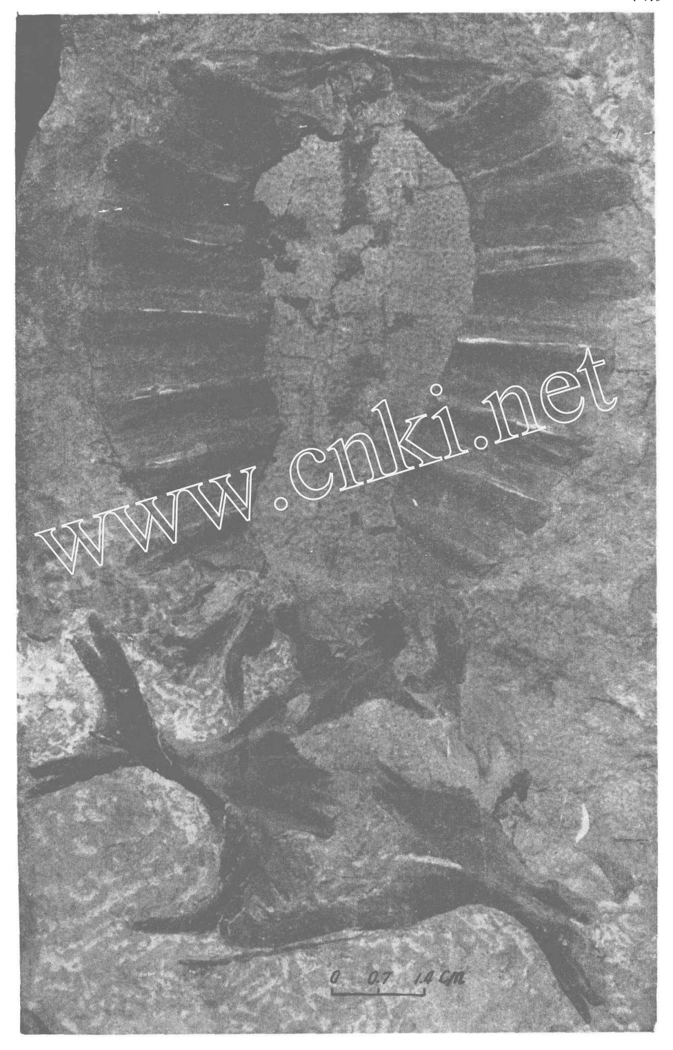
沐浴古鳖,新种 (Aspideretes muyuensis, sp. nov.) 分离保存的背、腹甲和部分腰带。腹视

(Ventral view of carapace, plastron and parts of pelvis.)