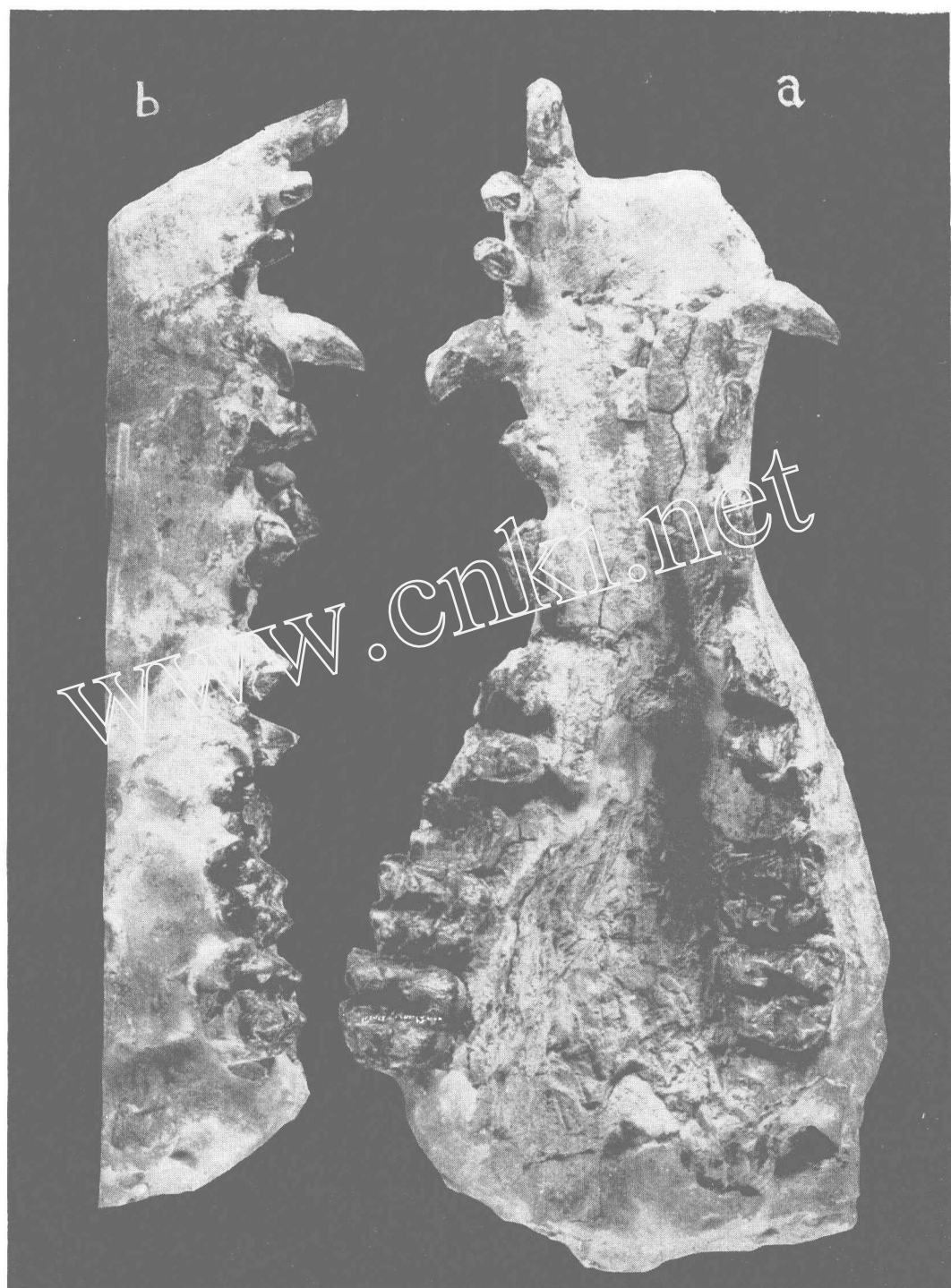
Anthracokeryx dawsoni sp. nov., V7915, \times 1 .