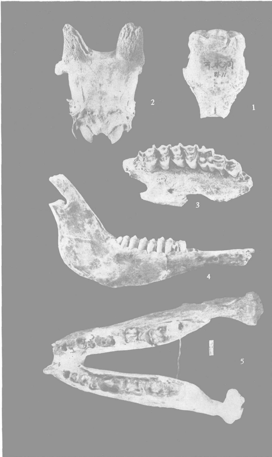
1.燕山雉,新种 ( Phasianus yanshansis sp. nov.)头骨,顶面, \times 1 ; 2.岩羊 ( Pseudois nayaur Hodgson) 头骨,后面, \times 1/2 ; 3.岩羊 ( Pseudois nayaur Hodgson) 右上颌骨,腭面,约 \times 1 ; 4.岩羊 ( Pseudois nayaur Hodgson) 右下颌骨,颊面, \times 1/2 ; 5. ? 双角犀 (? Dicerorhinus sp.) 下颌骨,嚼面, \times 1/5