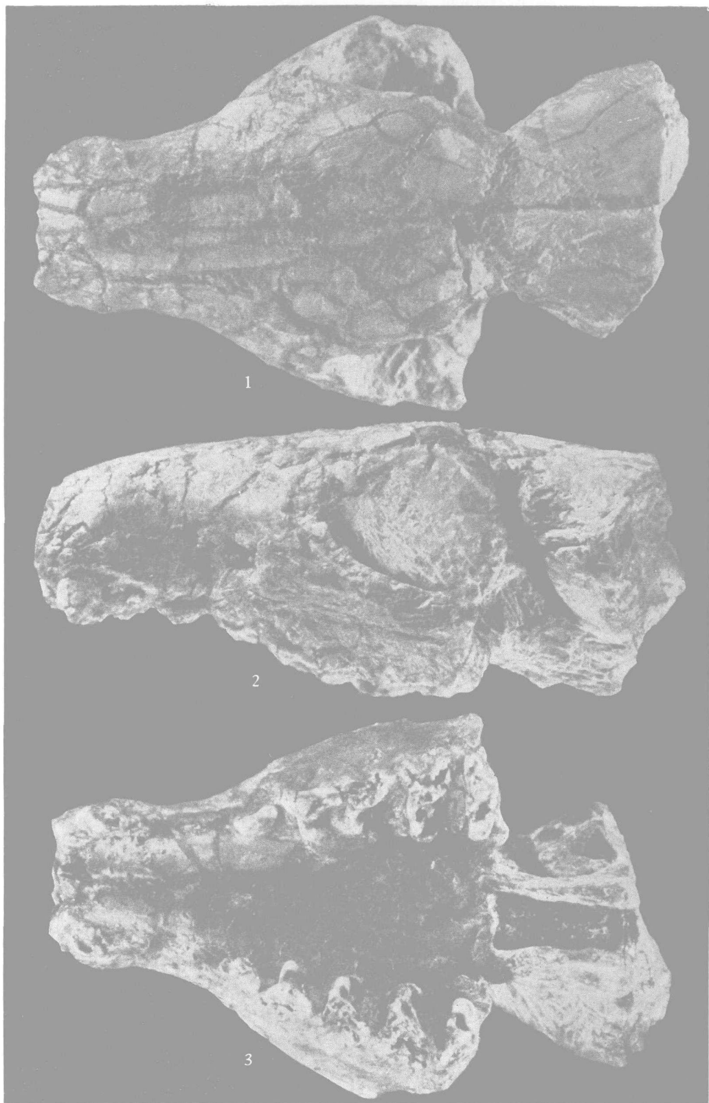
杨氏湘掠兽 ( Hsiangolestes youngi gen. et sp. nov.)

1—3. 残破头骨(V7353) 1. 顶面观; 2. 侧面观; 3. 腹面观。全部×3.5