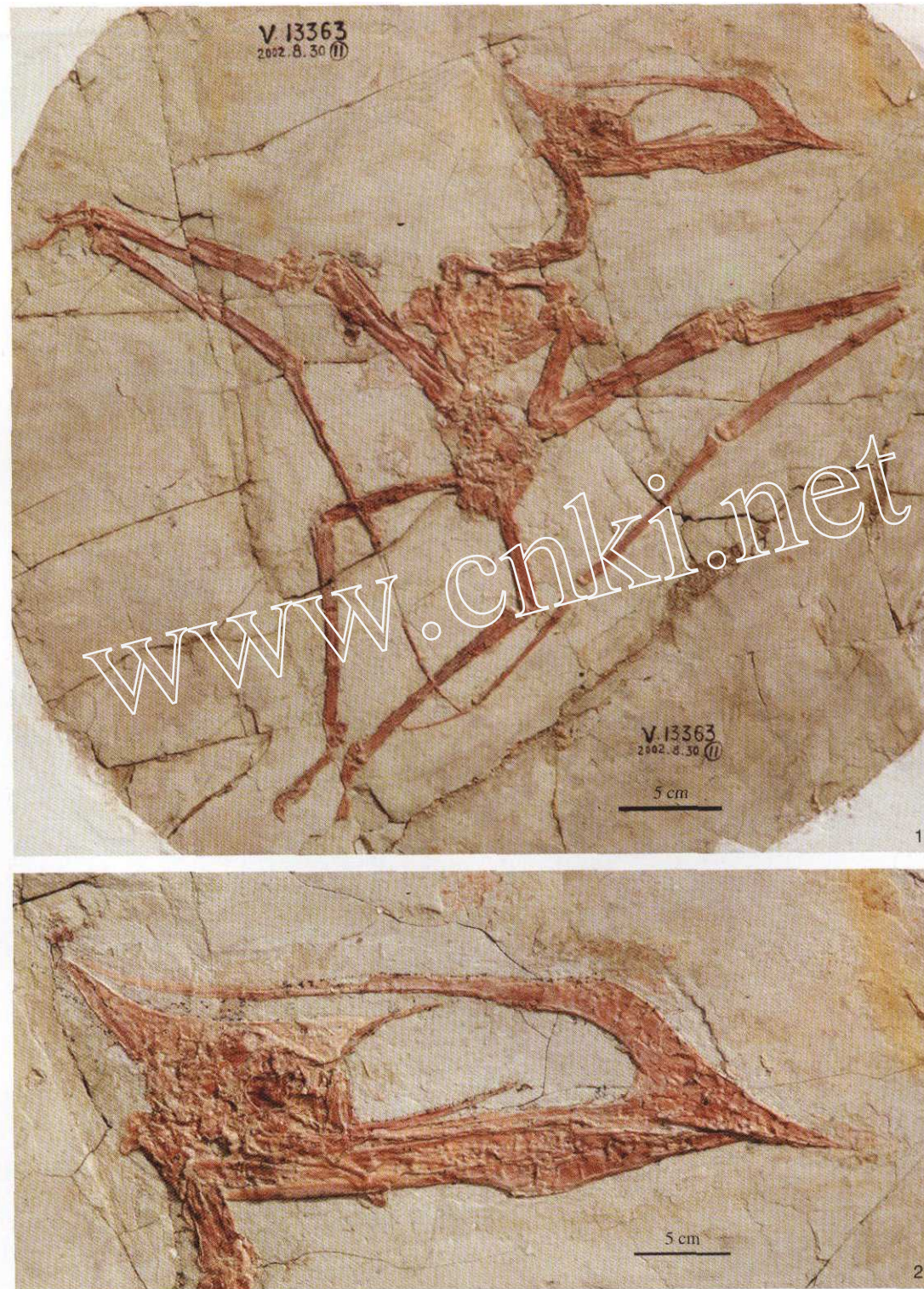
董氏中国翼龙(新属、新种) Sinopterus dongi gen. et sp. nov. (IVPP V 13363) 正型标本 1 骨架; 2. 头骨