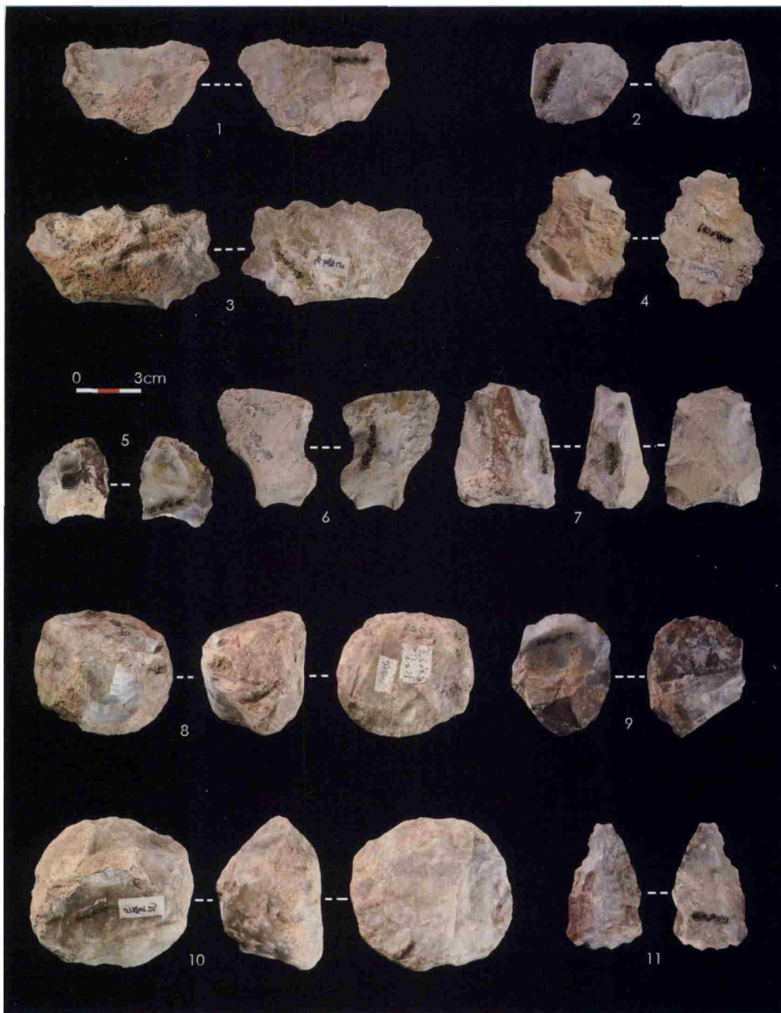
图 3 大窑 27 号洞出土的石器 / Fig.3 Retouched tools from the 27 th Cave