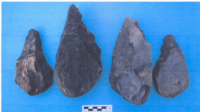
Fig. 2. Bifaces retrouvés dans le site paléolithique de Shuangshu (réserve du barrage de Danjiangkouou). Handaxes excavated from Shuangshu Paleolithic site in Danjiangkou Reservoir.