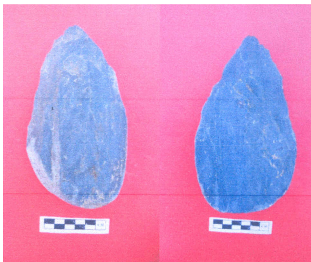
Fig. 8. Biface du site paléolithique de Waibianguou (réserve du barrage de Danjiangkouu). The handaxe from Waibianguou Paleolithic site in Danjiangkou Reservoir area.

La principale technique employée pour la production des artefacts lithiques du site est la percussion directe par percuteur dur, ainsi que la technique bipolaire sur enclume dont il reste des