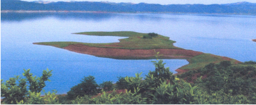
Fig. 9. Le site paléolithique de Datubaozi dans la réserve du barrage de Danjiangkouou. Datubaozi Paleolithic site in Danjiangkou Reservoir area.

preuves assez évidentes. La présence contemporaine du débitage et du façonnage est spécifique de la production lithique de cette période. Ces caractéristiques sont comparables à d'autres cultures paléolithiques de la Vallée d'Hanshui et appartiennent à la tradition de l'industrie sur galets du sud de la Chine.