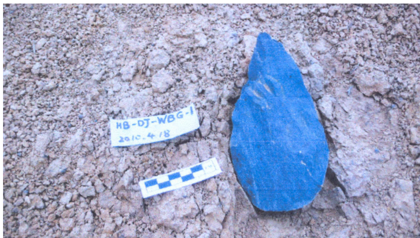
Fig. 7. Biface dans la terrasse T1 du site paléolithique de Waibianguou. The handaxe excavated at T1 in Waibianguou Paleolithic site.

Le biface est la pièce la plus importante pour rechercher les caractéristiques culturelles régionales de la Vallée de la rivière Hanshui. Néanmoins, il est tout aussi important d'effectuer une étude comparative entre les cultures paléolithiques de l'Ouest et de l'Est (Fig. 7).