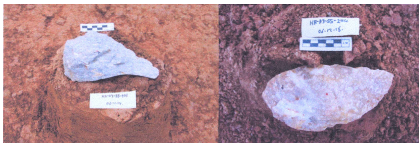
Fig. 3. Bifaces retrouvés dans le site paléolithique de Shuangshu. Handaxes excavated from Shuangshu Paleolithic site in Danjiangkou Reservoir area.