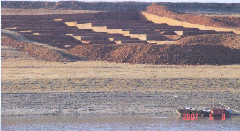
Fig. 1. Le site paléolithique de Shuangshu dans la réserve du barrage de Danjiangkouou. Shuangshu Paleolithic site in Danjiangkouou Reservoir area.

La plupart des artefacts ont conservé le cortex. Ces caractéristiques sont similaires avec d'autres sites du Paléolithique inférieur de la vallée de Hanshui et appartiennent à la tradition de l'industrie sur galets du sud de la Chine (Li Chao-Rong et Zhang Shuangquan, 2007).