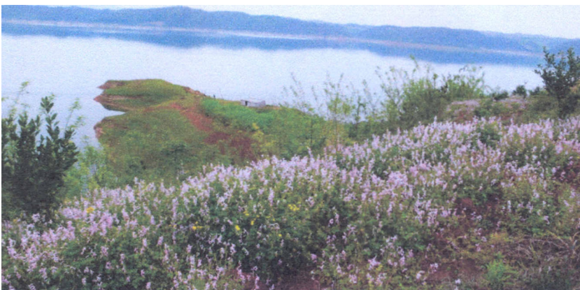
Fig. 6. Le site paléolithique de Waibiangou. Waibiangou Paleolithic site.

Cent vingt et une pièces lithiques ont été exhumées dans les zones A et B. Les artefacts lithiques comprennent des manuports, des nucléus, des éclats, des débris, des percuteurs, des enclumes, des grattoirs et des bifaces. En outre, environ 20 artefacts lithiques ont été recueillis dans le site et ils comprennent des nucléus, des éclats et des grattoirs. Dans la tranchée archéologique n° 1, quelques bifaces ont été découverts. Ces derniers ont été étudiés par des chercheurs chinois et étrangers.