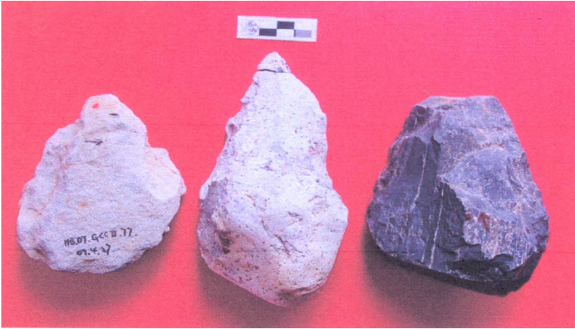
Fig. 5. Bifaces retrouvés dans le site paléolithique de Guochachang II (réserve du barrage de Danjiangkouou). Handaxes excavated from Guochachang II Paleolithic site in Danjiangkou Reservoir area.

3) Waibiangou est un site du Paléolithique inférieur daté du Pléistocène moyen. Le site est situé en rive droite de la troisième terrasse de la rivière Hanshui. Les coordonnées géographiques sont 3 09'26 "E et 32°36'02"N et la hauteur au-dessus du niveau de la mer est d'environ 158 mètres (Fig. 6).