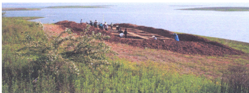
Fig. 4. Le site paléolithique de Guochachang II dans la réserve du barrage de Danjiangkouou. Guochachang II Paleolithic site in Danjiangkou Reservoir area.